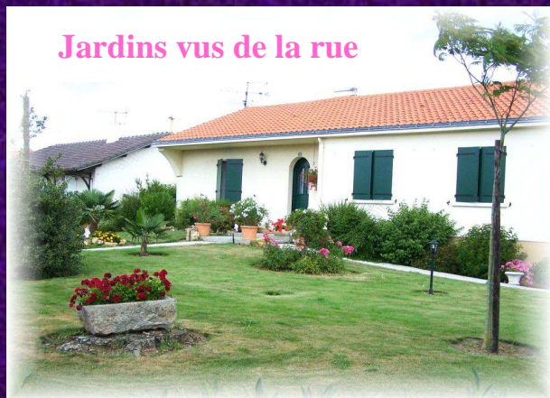
Jardins vus de la rue