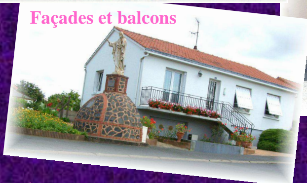
Façades et balcons