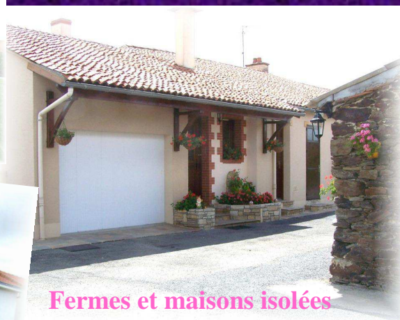
Maisons fleuries 2013 : Les 3 premiers lauréats de la 10 ème édition