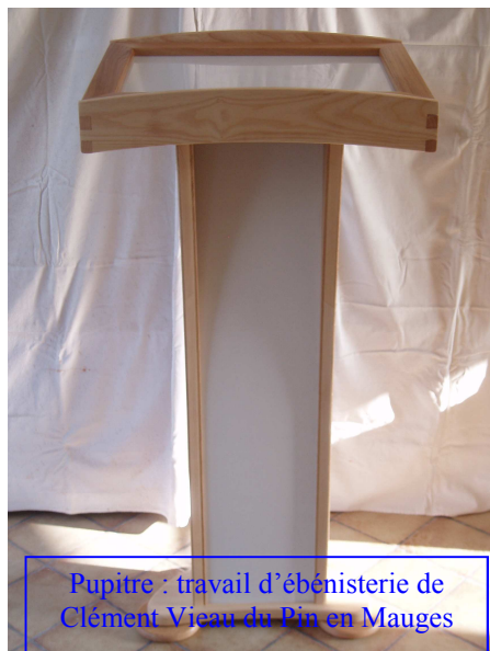
Pupitre : travail d'ébénisterie de Clément Vieau du Pin en Mauges

Place : 22 € / Réservation avant le 12 février.