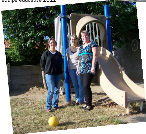
Écoles de la Salle et Chapelle-Aubry : Rentrée 2012.