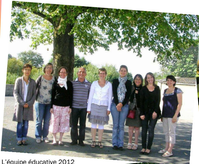
L'équipe éducative 2012