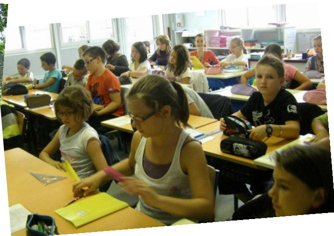
Les jeunes ont retrouvé les bancs dans la bonne humeur.