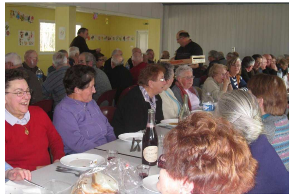
Club de l'Amitié

Un franc succès pour l'après-midi "pot-au-feu"