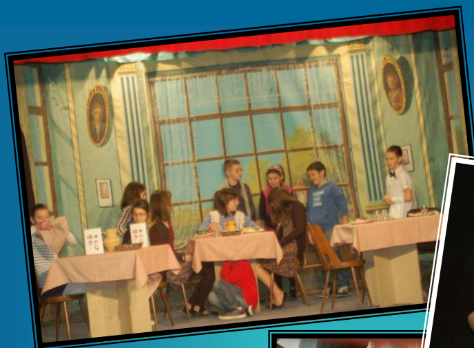
Au restaurant avec la famille catastrophe