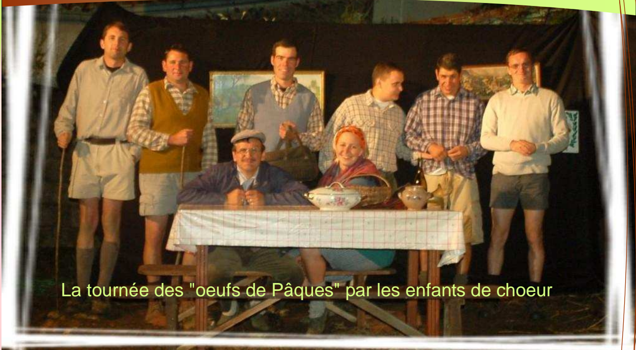
La tournée des "oeufs de Pâques" par les enfants de chœur